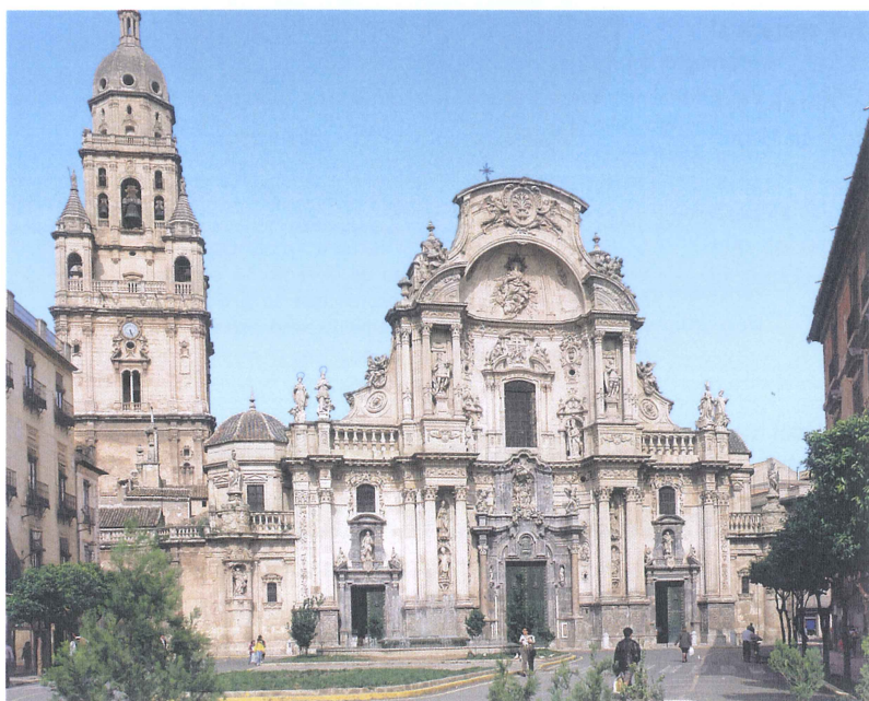
Fachada de la catedral de Murcia (1742-1754), obra maestra del arte barroco murciano y un punto de referencia universal dentro de este movimiento.